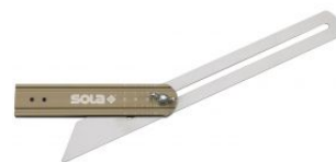
Falsa escuadra con graduación de ángulos VSTG at.com.es/p/1018353