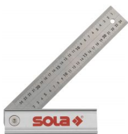
Escuadra ajustable de acero inoxidable QUATTRO at.com.es/p/1018351