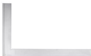
Escuadra de cerrajero con alas SWA at.com.es/p/1018356