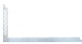
Escuadra de carpintero de obra ZWZA at.com.es/p/1018357