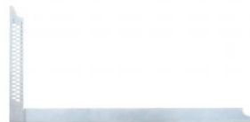
Escuadra de carpintero de obra ZWZA