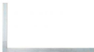
Escuadra de cerrajero SW