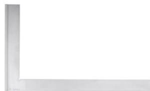
Escuadra de cerrajero con alas SWA