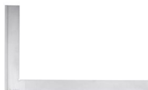
Escuadra de cerrajero con alas SWA