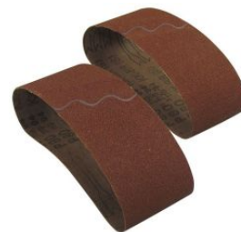
Banda lijadora portátil óxido de aluminio