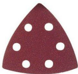
Hojas delta papel abrasivo A/O autoadherente KE.RR