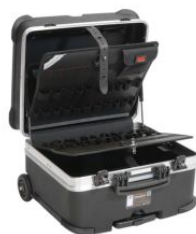
Maleta portaherramientas Rock Turtle PEL