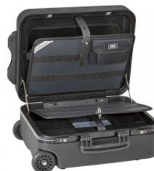
Maleta portaherramientas New Mega Wheels PEL