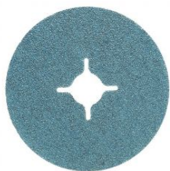
Disco de fibra zirconio alúmina (Pack de 25 uds.)