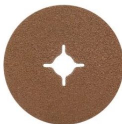
Disco de fibra óxido de aluminio (Pack de 25 uds.)