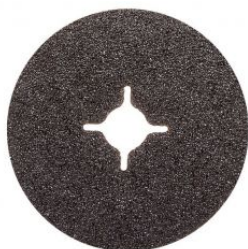
Disco de fibra carburo de silicio (en caja de 25 uds.)