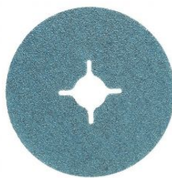
Disco de fibra zirconio alúmina (Pack de 25 uds.)