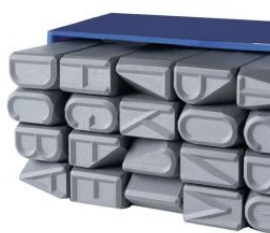
Abecedario medidas especiales 20mm - Standard at.com.es/p/1018967