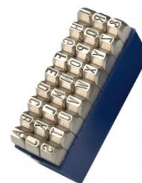
Abecedarios Nº 1 extra- extra - Especial para acero Inox at.com.es/p/1018968