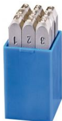
Numeraciones SR - Standard at.com.es/p/1017853