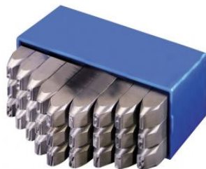
Abecedarios Special - Trabajos exigentes