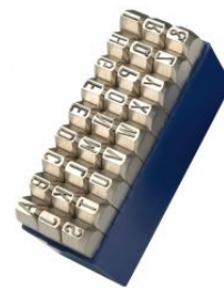
Abecedarios Nº 1 extra- extra - Especial para acero Inox