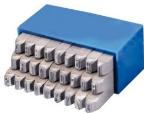
Abecedarios SR - Standard