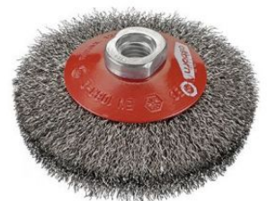
Cepillos cónicos ondulados - Tuerca M14 at.com.es/p/1019274