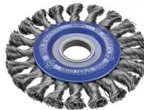
Cepillos circulares alambre trenzado - Agujero 22,2mm at.com.es/p/1019265