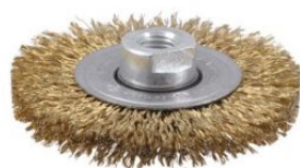
Cepillo circular de alambre ondulado con tuerca M14