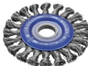
Cepillos circulares alambre trenzado - Agujero 22,2mm