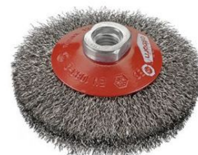
Cepillos cónicos ondulados - Tuerca M14