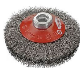
Cepillos cónicos ondulados - Tuerca M14 at.com.es/p/1019274