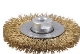
Cepillo circular de alambre ondulado con tuerca M14 at.com.es/p/1019256