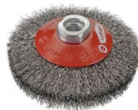
Cepillos cónicos ondulados - Tuerca M14 at.com.es/p/1019274