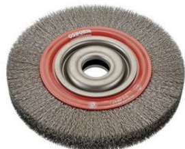
Cepillos circulares de alambre ondulado con agujero multieje at.com.es/p/1019255