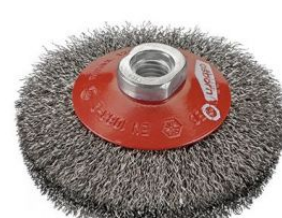
Cepillos cónicos ondulados - Tuerca M14 at.com.es/p/1019274