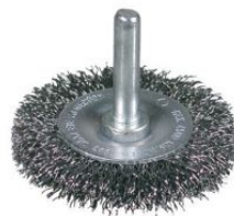
Cepillos circulares ondulados - Vástago 6mm (4.500 RPM) at.com.es/p/1019261