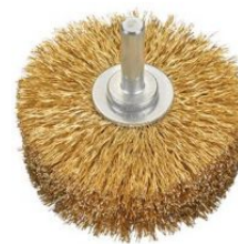
Cepillos circulares alambre ondulado - Vástago 8mm (Extra espesor) at.com.es/p/1019264