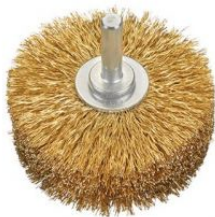
Cepillos circulares alambre ondulado - Vástago 8mm (Extra espesor) at.com.es/p/1019264