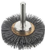
Cepillos circulares filamento abrasivo - Vástago 6mm at.com.es/p/1019260