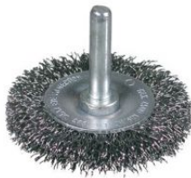
Cepillos circulares ondulados - Vástago 6mm (4.500 RPM) at.com.es/p/1019261