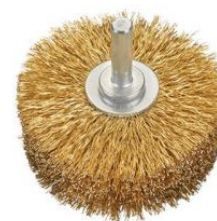
Cepillos circulares alambre ondulado - Vástago 8mm (Extra espesor) at.com.es/p/1019264