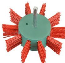
Cepillos circulares segmentados - Vástago 6mm