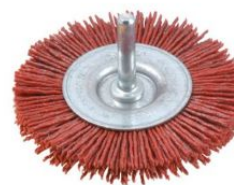
Cepillos circulares filamento abrasivo - Vástago 6mm (4.500 RPM)