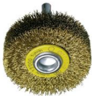
Cepillos circulares alambre ondulado - Vástago 6mm (Amoladora recta altas revoluciones)