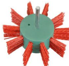
Cepillos circulares segmentados - Vástago 6mm