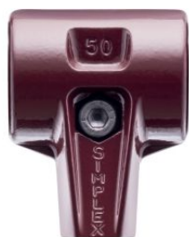
Cuerpo de acero fundido para maza Simplex