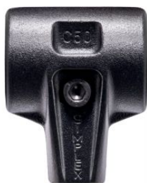
Cuerpo de acero fundido reforzado para maza Simplex