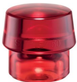
Boca de plástico rojo para mazas Simplex