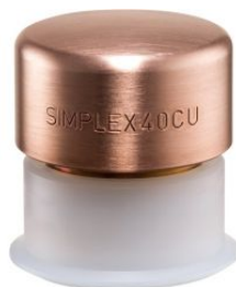
Boca de cobre para mazas Simplex