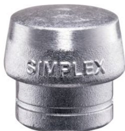
Boca de metal blando para mazas Simplex