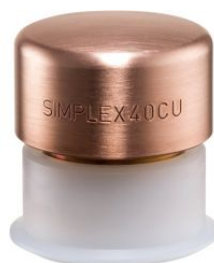
Boca de cobre para mazas Simplex