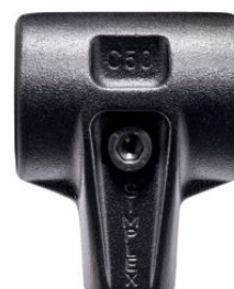
Cuerpo de acero fundido reforzado para maza Simplex