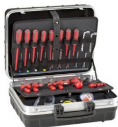
Maleta portaherramientas Atomik 215 PEL at.com.es/p/1018624