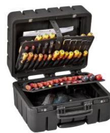
Maleta portaherramientas Pivot PTS at.com.es/p/1019445