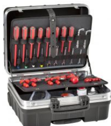
Maleta portaherramientas Atomik Wheels PEL at.com.es/p/1018625