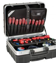
Maleta portaherramientas Atomik Wheels PTS