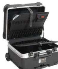
Maleta portaherramientas Rock Turtle PTS