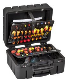
Maleta portaherramientas Pivot PEL