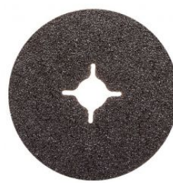
Disco de fibra carburo de silicio (en caja de 25 uds.)