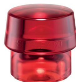
Boca de plástico rojo para mazas Simplex