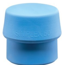
Bocas de TPE azul para mazas Simplex