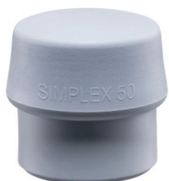
Boca de TPE gris para mazas Simplex