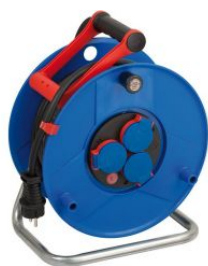
Enrollacables Garant® IP44 con asa "CablePilot" at.com.es/p/1019990