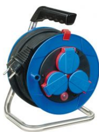
Enrollacables Garant® IP44 compacto con cable Bremaxx® at.com.es/p/1019991