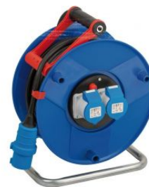
Enrollacables Garant® IP44 H07RN-F 3G2,5 para la industria y construcción con tomas CEE at.com.es/p/1019992