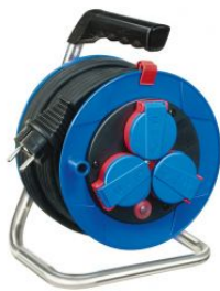
Enrollacables Garant® IP44 compacto con cable Bremaxx® at.com.es/p/1019991