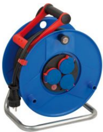
Enrollacables Garant® IP44 con asa "CablePilot" at.com.es/p/1019990