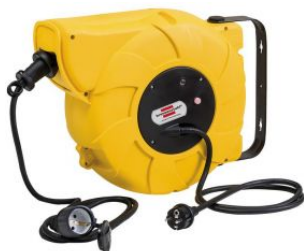
Enrollacables de carrete automático IP44 H07RN-F 3G1,5 para la industria y construcción at.com.es/p/1020000