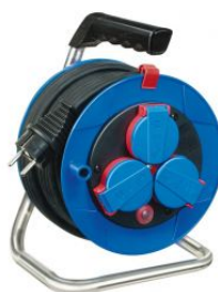
Enrollacables Garant® IP44 compacto con cable Bremaxx® at.com.es/p/1019991