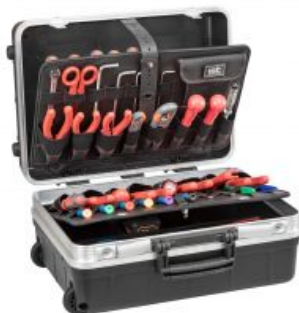
Herramientas NO incluidas