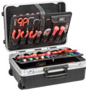
Herramientas NO incluidas