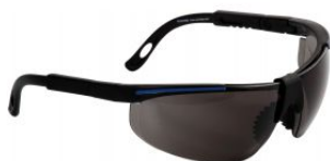
Gafas de seguridad oscuras RUNNER at.com.es/p/1018613