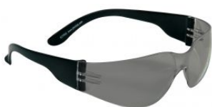
Gafas de seguridad oscuras ECO at.com.es/p/1019036