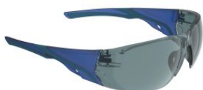
Gafas de seguridad SPARK con lente solar at.com.es/p/1652167