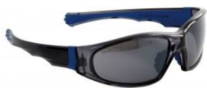
Gafas de seguridad espejo EAGLE at.com.es/p/1018607