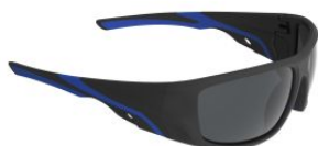
Gafas de seguridad EDGE con lente solar espejo at.com.es/p/1652170