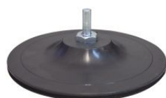
Base lijadora autoadherente grip con espiga para taladros PDG