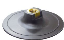
Base lijadora autoadherente para amoladoras angulares PGV