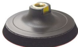
Base lijadora flexible autoadherente para amoladoras angulares PGVF