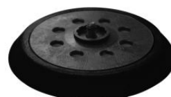
Base lijadora flexible autoadherente profesional para rotorbitales PSVP