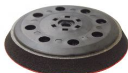
Base lijadora flexible autoadherente para rotorbitales PSV