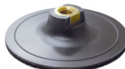
Base lijadora autoadherente grip para amoladoras angulares PGG