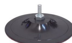
Base lijadora autoadherente con espiga para taladros PDV