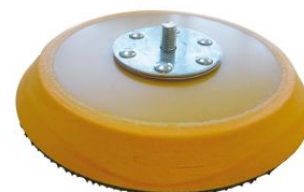
Base lijadora flexible autoadherente grip profesional para rotorbitales PSVPG