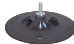
Base lijadora autoadherente con espiga para taladros PDV