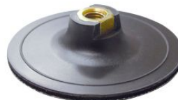
Base lijadora autoadherente grip para amoladoras angulares PGG