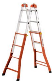
Escalera multiposición telescópica mixta PEPPina MIX125 at.com.es/p/1019017