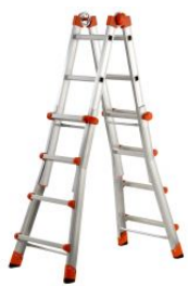
Escalera multifunción telescópica de aluminio PEPPina ALU150 at.com.es/p/1018575