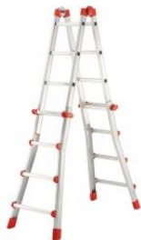
Escalera multifunción telescópica de aluminio ProfiStep Multi EN131-4 at.com.es/p/1018568