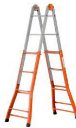
Escalera multifunción telescópica de acero PEPPina FE125 at.com.es/p/1018576