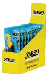
Cúter con bloqueo automático y púa multiusos L5 en caja dispensadora