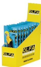
Cúter con bloqueo automático y púa multiusos L5 en caja dispensadora