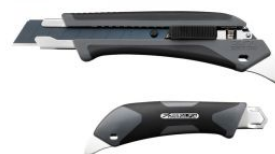
Cúter L5-AL/GRY con bloqueo automático gris (20 aniversario)