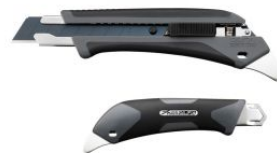
Cúter L5-AL/GRY con bloqueo automático gris (20 aniversario)