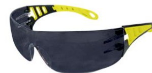
Gafas de seguridad solares con patillas amarillas EVO at.com.es/p/1226263