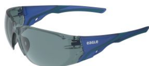
Gafas de seguridad SPARK con lente solar at.com.es/p/1652167