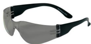
Gafas de seguridad oscuras ECO at.com.es/p/1019036