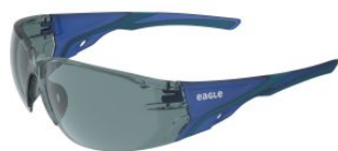
SPARK Gafas de seguridad con lente solar at.com.es/p/1652167