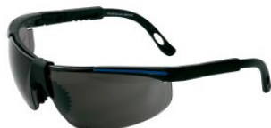
Gafas de seguridad oscuras RUNNER at.com.es/p/1018613