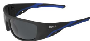
EDGE Gafas de seguridad con lente solar espejo at.com.es/p/1652170