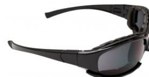
Gafas de seguridad oscuras INDRO at.com.es/p/1019030