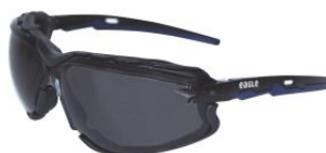
Gafas de seguridad oscuras ORSO at.com.es/p/1019702