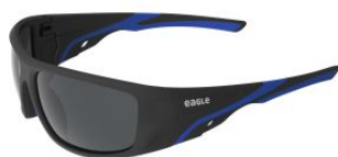
Gafas de seguridad EDGE con lente solar espejo at.com.es/p/1652170