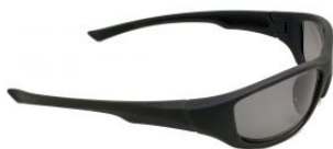
Gafas de seguridad oscuras FOLCO at.com.es/p/1019404